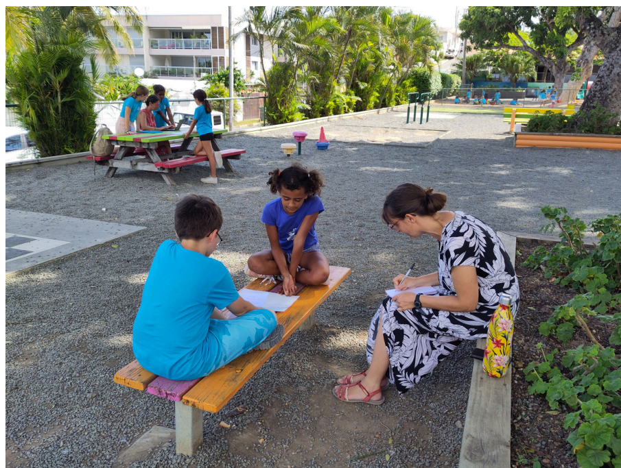
Nous posons des questions à chaque enfant sur ce qu'il a dessiné.