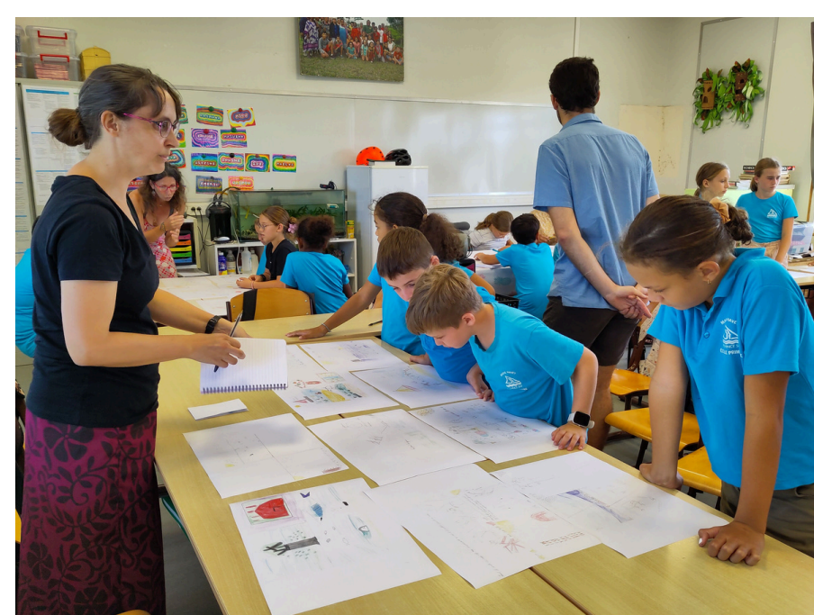
Nous trions et nous analysons les dessins.