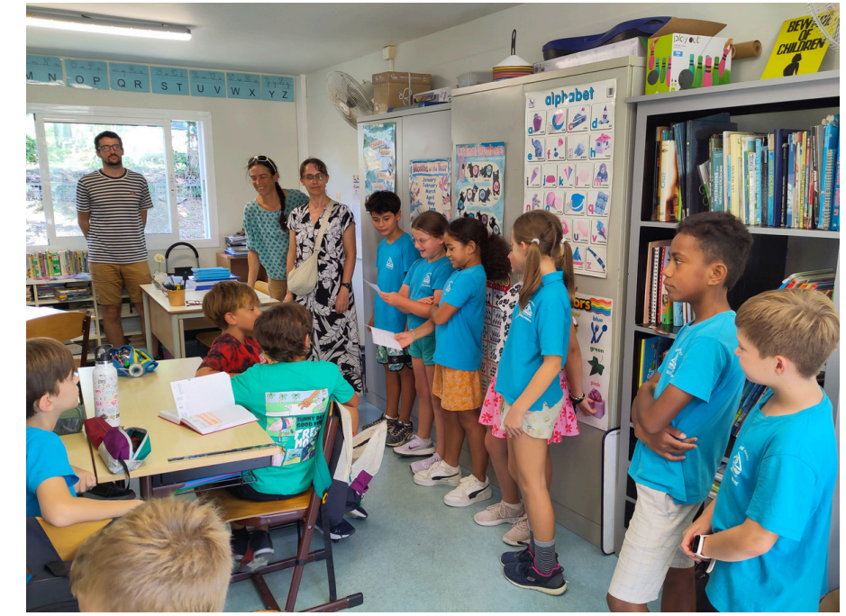
Nous expliquons à l'autre classe ce qu'il faut faire.