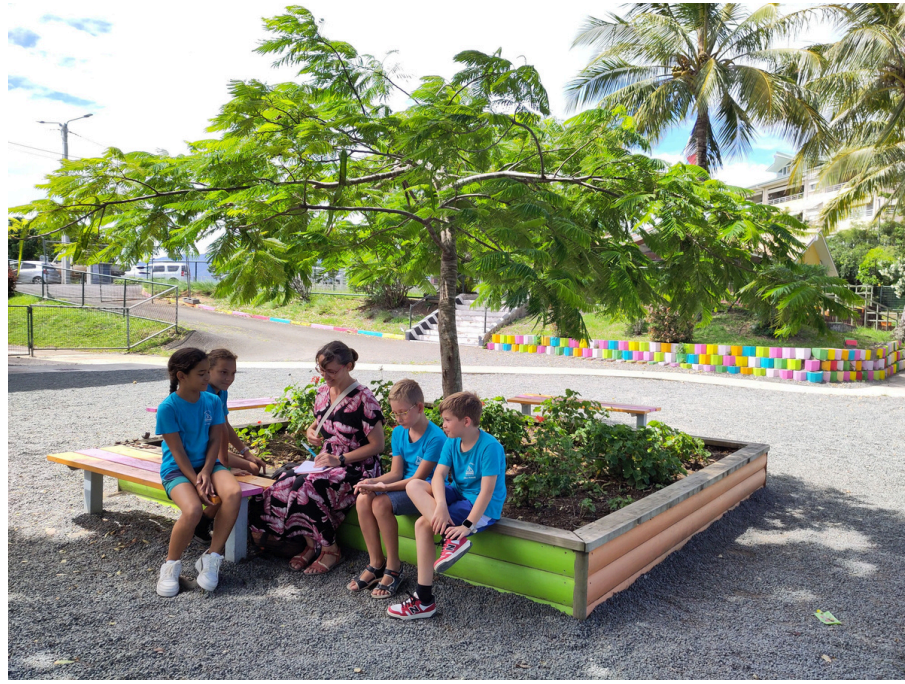
Travail par petits groupes avec les grands co-chercheurs